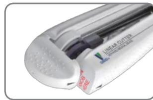
* Perilla de disparo de dos vías