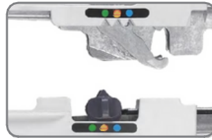
* Altura de grapado ajustable