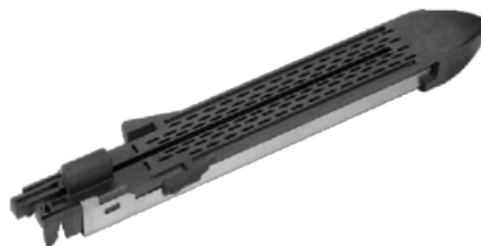
Recarga de grapas LCR55×4,3mm