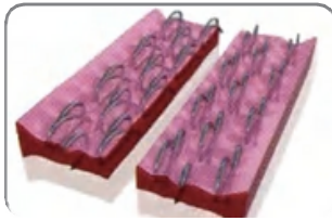
* 6 filas de grapas y grapas 3D