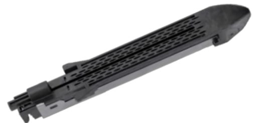
Recarga de grapas LCR75×4,3mm