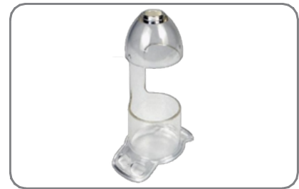
*La sonda en C permite el tratamiento de las hemorroides para las hemorroides más grandes, al tiempo que previene los problemas de estenosis graves de la HPP.