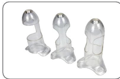
*Accesorios de resección seleccionables