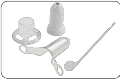
*Accesorios de resección circunferencial